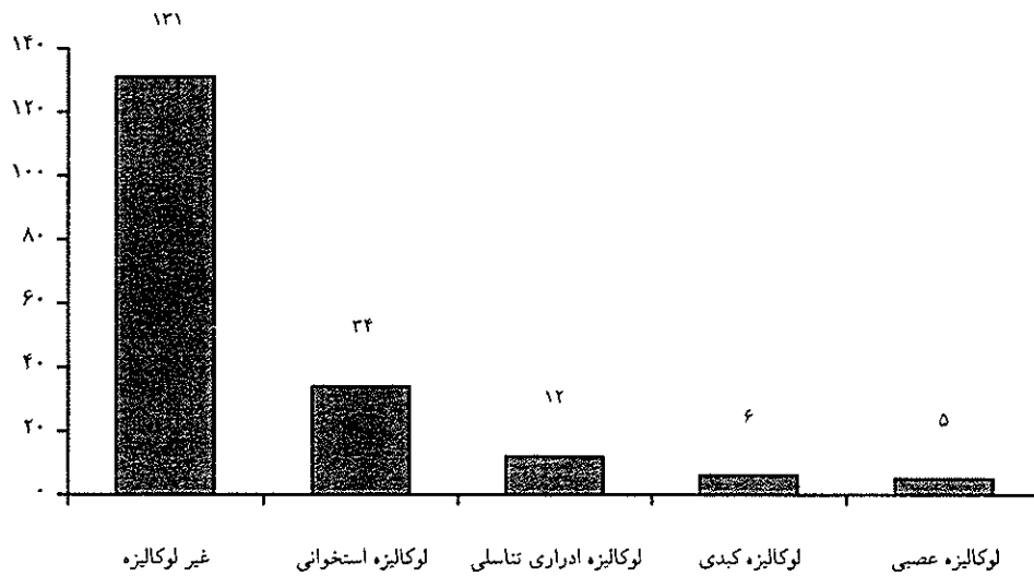
نمودار ۳- اشکال بالینی بیماری در بیماران مبتلا به بروسلوز بستری شده در مجتمع آموزشی- درمانی امام خمینی طی ۷ سال (n=۱۸۸)

میانگین سنی بیماران مورد بررسی قرار گرفته در مطالعه ما ۳۴/۸ سال بود که در مطالعات قبلی ایران نیز شیوع بیماری در سنین جوانی بخصوص در گروه سنی ۲۹-۲۰ سال گزارش شده است (۶). در مطالعه Colmonero JD و همکارانش میانگین سنی ۳۷/۵ سال گزارش شده است (۲۱). در مطالعه سال ۱۹۹۷ عربستان سعودی نیز سن متوسط ۳۲ سال گزارش شده است (۱۹) که تا حدودی با آمار ما مطابقت دارد.