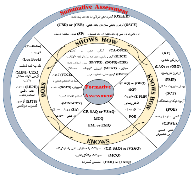
شکل ۱: مدل هسته‌ای روش و قالب ارزیابی براساس چهار سطح هرم میلر

پس از انجام جستجو و غربالگری‌های ذکرشده در متدولوژی، ۱۱۶ مقاله انتخاب و با توجه به الگوی تطبیقی Bredy مورد مقایسه و تحلیل قرار گرفتند. نتایج نشان‌دهنده پیش‌روی سنجش آموزش پزشکی به سمت قالب ارزیابی تکوینی و استفاده از روش‌های نوین در کنار روش‌های سنتی کارآمد بود که به وضوح در بررسی کوریکولوم دانشگاه‌های معتبر هاروارد، استنفورد و آکسفورد، نیز به چشم می‌خورد. ۷، ۸ طبق مرور متون، سنتی بودن یک روش عاملی برای کنار گذاردن آن نیست، بلکه باید در مسیر بهبود کیفیت آن تلاش نمود. مهمترین مساله‌ای که می‌توان بیان نمود این است که برای استفاده از انواع روش‌های ارزیابی در هر یک از قالب‌های تکوینی-تراکمی اجماعی وجود نداشت و اجماع به‌سمت استفاده درست از انواع روش‌ها و تاکید بر به‌کارگیری قالب ارزیابی تکوینی در کنار تراکمی بوده در حالی که در برخی نتایج داخل کشور معیار اصلی ارزیابی فقط آزمون پایان‌ترم و روش‌های متداول سنجش بوده است. پس از جمع‌آوری نظر متخصصان در جلسه متمرکز گروهی،