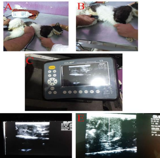
شکل ۱: تعیین محل کلیه با استفاده از سونوگرافی برای دو مرحله تزریق سلول در روزهای ۱ و ۱۴. (A) آماده کردن حیوان برای سونوگرافی و قراردادن آن در موقعیت مناسب. (B) پیدا کردن محل دقیق کلیه با استفاده از سونوگرافی. (C) تصویر کلیه گربه در دستگاه سونوگرافی مورد استفاده در این پژوهش (دستگاه سونوگرافی EMP ساخت کشور چین). (D) بررسی وضعیت دقیق کلیه حیوان مبتلا به بیماری مزمن کلیه با استفاده از امواج سونوگرافی. (E) تعیین محل دقیق تزریق سلول به کلیه که با خط سفید رنگ در تصویر نشان داده شده است.

پیوند سلول های بنیادی مزانشیمی به صورت اتولوگ انجام شد. در روز اول آزمایش اوره 42/8 < ، کراتینین 2/1 < و BUN > 32 و ALT > 100 در همه حیوانات به جز گروه کنترل (حیوانات سالم) مشاهده شد. در روز ۳۰، مقدار BUN و SCR در حیوانات در همه گروه های آزمایشی به جز حیوانات سالم کاهش کمی داشت، اما از نظر آماری معنادار نبود که می تواند به دلیل مایع درمانی و تنظیم رژیم غذایی باشد. اندازه گیری کراتینین در بررسی بیماری های کلیوی اهمیت دارد، مقدار نرمال آن 1/5 - 0/5 میلی گرم در دسی لیتر خون