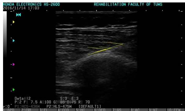
تصویر ۲: نمایی از اندازه‌گیری زاویه پنینشن در عضله VMO.

تحلیل آماری، جهت بررسی نرمال بودن داده‌ها از آزمون شاپیرو-ویلک (Shapiro-Wilk test) استفاده گردید. جهت بررسی تکرارپذیری درون‌گروهی سونوگرافی از ضریب همبستگی درون‌گروهی (Intraclass correlation coefficient, ICC)، خطای معیار اندازه‌گیری (Standard error of measurement, SEM) و کمترین تغییر قابل تشخیص (Minimal detectable change, MDC) استفاده گردید. در صورتی‌که مقادیر ICC کمتر از ۰/۵ باشد، تکرارپذیری ضعیف، بین ۰/۵-۰/۷۵ باشد، تکرارپذیری متوسط، بین ۰/۷۵-۰/۹ باشد خوب و بالاتر از ۰/۹ تکرارپذیری عالی محسوب می‌گردد. ۳۳ از Independent T-test جهت مقایسه بین دو گروه افراد با وضعیت پای پرونیت شده و افراد با وضعیت پای سالم استفاده گردید. تحلیل‌های آماری با استفاده از SPSS software, version 22 (SPSS Inc., Chicago, IL, USA) صورت گرفت. سطح معناداری ۰/۰۵ در نظر گرفته شد.