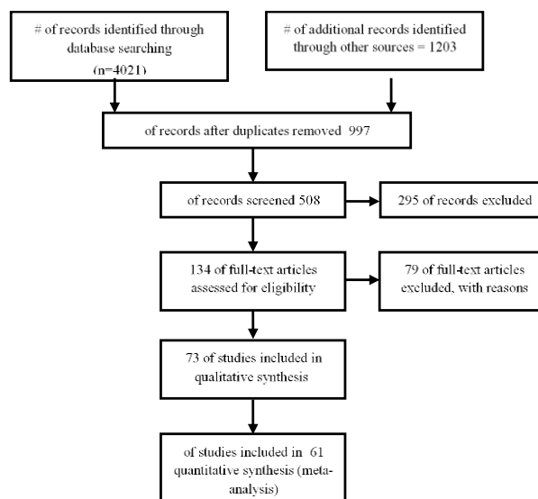
نمودار ۱: فلوجارت انتخاب مطالعات وارد شده در فرآیند متآنالیز

در مطالعه متآنالیز شبکه‌ای بی‌زی Lu همکاران، که با عنوان "تاثیر و ایمنی درمان طولانی مدت با استاتین‌ها برای بیماری قلبی-عروقی" صورت گرفت، اثرات مستقیم و غیرمستقیم بین استاتین‌های مختلف را مورد بررسی قرار داد. اثربخشی نتایج شامل تغییر در لیپیدهای خون و خطر مرگ‌ومیر بیماری قلبی-عروقی و مرگ‌ومیر در همه موارد بود. نتایج این مطالعه نشان داد که سطوح لیپیدهای چربی در خون با استاتین‌ها کاهش می‌یابد. ۲۲