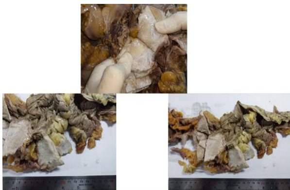
تصویر شماره ۲: تصاویر ناخالص نمونه‌ی همی‌کولکتومی راست که یک توده‌ی زیر مخاطی با حدود مشخص (در سطح برش جامد و سفید دیده می‌شود) نشان می‌دهد.

مزوکولون راست با لنف‌نودها خارج شدند بیمار علائم حیاتی پایدار داشت آناستوموز انتها به کنار ایلئوم به کولون عرضی انجام شد و ادامه‌ی عمل طبق مراحل استاندارد به اتمام رسید. (تصویر شماره ۲).