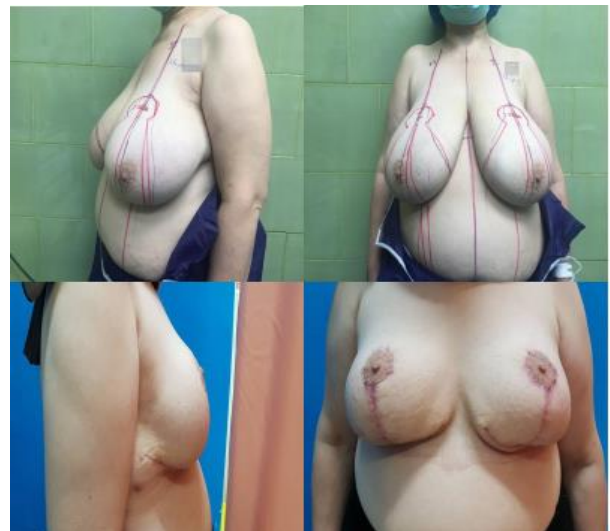
تصویر شماره ۴: پیش و پس از عمل جراحی