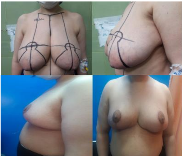
تصویر شماره ۳: پیش و پس از عمل جراحی

چقدر از نتیجه زیبایی عمل جراحی در مقیاس یک تا پنج راضی هستید؟ (یک کمترین رضایت، پنج بیشترین رضایت)