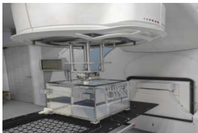
شکل ۲: فانتوم آب همگن

تابش دهی ژل: یک روز بعد از آماده سازی ژل، آن را با دستگاه شتاب دهنده خطی مدل Elekta در مد الکترون تحت تابش قرار داده شد. با قرارگیری فریم هایی از جنس آلایاز سرویند به ضخامت ۱ cm به انتهای اپلیکاتور ۶×۶ cm 2 ، میدان هایی به ابعاد ۲×۲ cm 2 ، ۲/۵×۲/۵ cm 2 ، ۳×۳ cm 2 ، ۴×۴ cm 2 و ۵×۵ cm 2 ساخته شدند. در این مطالعه برای تابش دهی به ژل ها از انرژی های ۶ و ۹ مگا الکترون ولت استفاده شده است. در شرایطی که SSD=100 cm است، برای جمع آوری داده ها، ویال های ژل را به صورت جداگانه در داخل فانتوم آب قرار داده و با اعمال تک دوز 6Gy تحت تابش قرار گرفتند (شکل ۲).