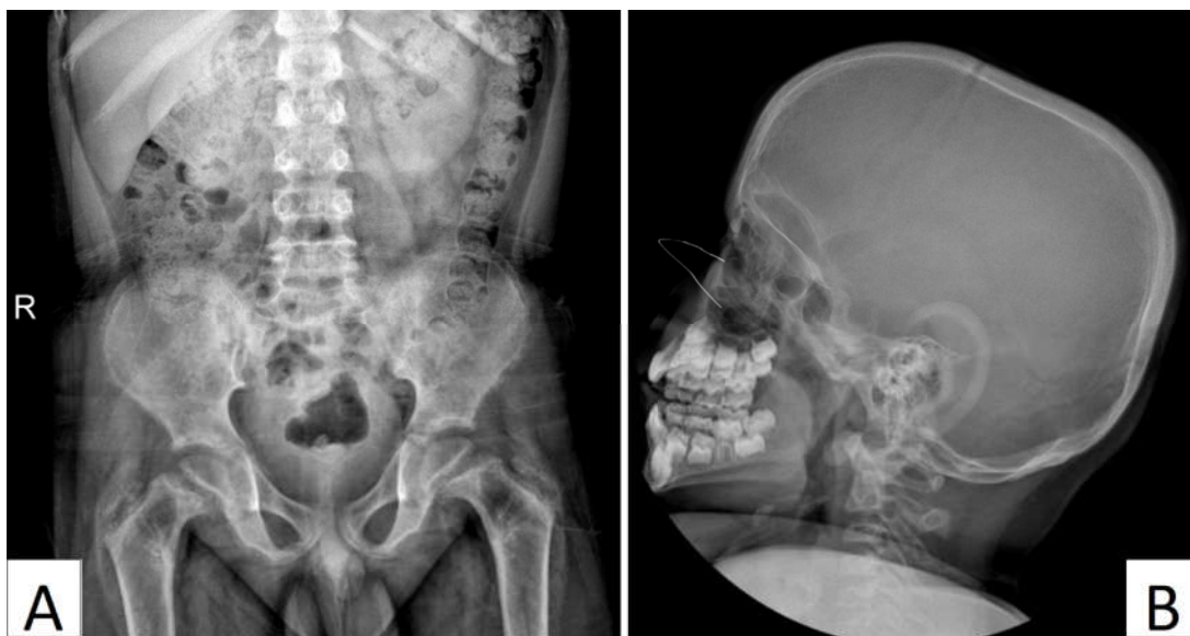
شکل ۴: Subperiosteal resorption در سمفیز پویس و گردن فمور (A)، افزایش ضخامت کالواریا (B)

استخوان، خستگی و اختلالات گوارشی متغیر باشد. ۳ ارزیابی آزمایشگاهی معمولاً سطوح بالای کلسیم سرم و هورمون PTH همراه با سطح فسفات طبیعی تا پایین نشان می‌دهد که تشخیص را تأیید می‌کند. ۴ تشخیص افتراقی هیپرکلسمی در کودکان شامل هیپرکلسمی خانوادگی هیپوکلسیوریک، هیپرکلسمی مرتبط با بدخیمی و مسمومیت با ویتامین D می‌باشد. در تشخیص هایپرپاراتیروئیدیسم اولیه، تمایز میان علل مختلف مانند آدنوم یا هایپرپلازی غده پاراتیروئید ضروری است. ۵ آدنوم‌های پاراتیروئید معمولاً به صورت اسپورادیک رخ می‌دهند، اما ممکن است بخشی از سندرم‌های ژنتیکی مانند نئوپلازی اندوکرین متعدد (MEN) انواع ۱، ۲ A و ۴، سندرم تومور فک-هایپرپاراتیروئیدیسم (Hyperparathyroidism-Jaw Tumor, HPT-JT) و هایپرپاراتیروئیدیسم خانوادگی ایزوله باشند. ۶ روش‌های تصویربرداری مانند سونوگرافی و سیتی‌گرافی با استفاده از ۹۹mTc سستامی، ابزارهای اصلی برای شناسایی آدنوم‌های پاراتیروئید محسوب می‌شوند. ۲ درمان انتخابی برای آدنوم‌های پاراتیروئید، برداشتن جراحی آنها است که معمولاً در برطرف کردن هایپرکلسمی و رفع علائم بسیار مؤثر است (جدول ۱). ۷