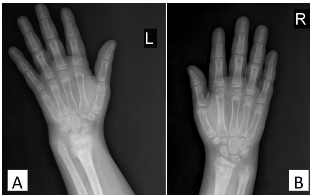
شکل ۲: Bone resorption و دفورمیتی‌های شدید در دیستال استخوان‌های رادیوس و اولنا، جابه‌جایی مفاصل میج دست، افزایش فاصله بین رادیوس و اولنا