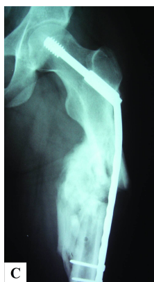
پایان سال اول صورت گرفت. جوش خوردن تمام بیماران در نهایت مشاهده شد (شکل ۲) (جدول ۱).