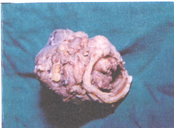
شکل ۲- نمای ماکروسکوپی تومور جراحی شده

مری شده است (۵، ۶، ۷، ۱۴). با پیشرفت روشهای رزکسیون لوله‌ای Sleeve resection تراشه و و قسمتی از حنجره و آناستوموز مجدد آن، محدودیت جراحی در تومور تیروئید مهاجم به راه هوایی با حفظ حنجره از بین رفته است.