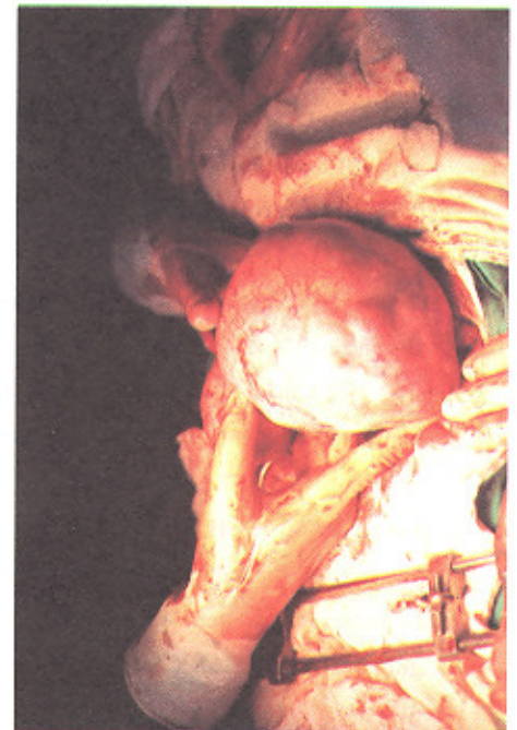
شکل شماره ۲: رحم طبیعی کوچک در خط وسط سمت راست بیمار

نکته جالب در بیمار مورد نظر رشد پستان‌ها بود که به نظر می‌رسد علت آن تولید تدریجی استروژن به مدت طولانی از توده تومورال بوده است همچنین لازم به ذکر است که در یک نمونه خون غلظت استرادیول بیمار نسبتاً پائین بود.