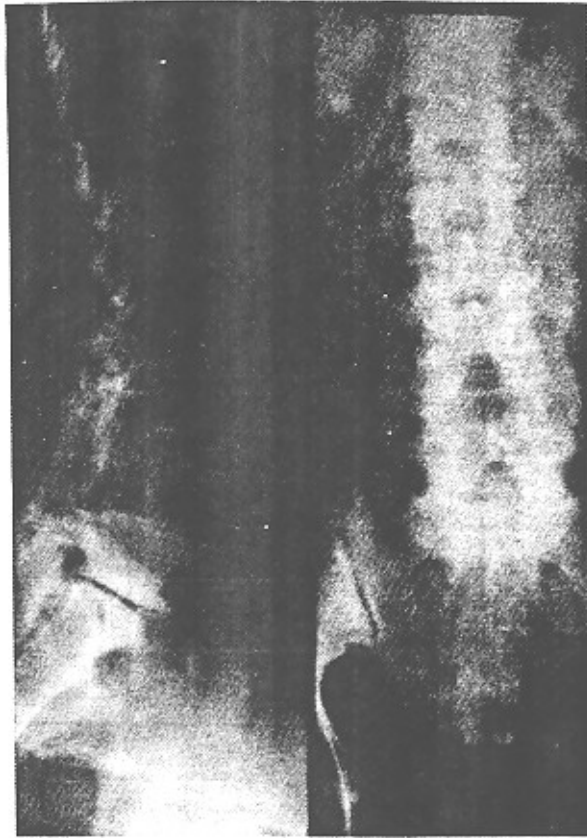
تصویر شماره ۲- درمان نابجا - لیستریس مهره ها که لامینکتومی گمری باعث پیشرفت آن شده است