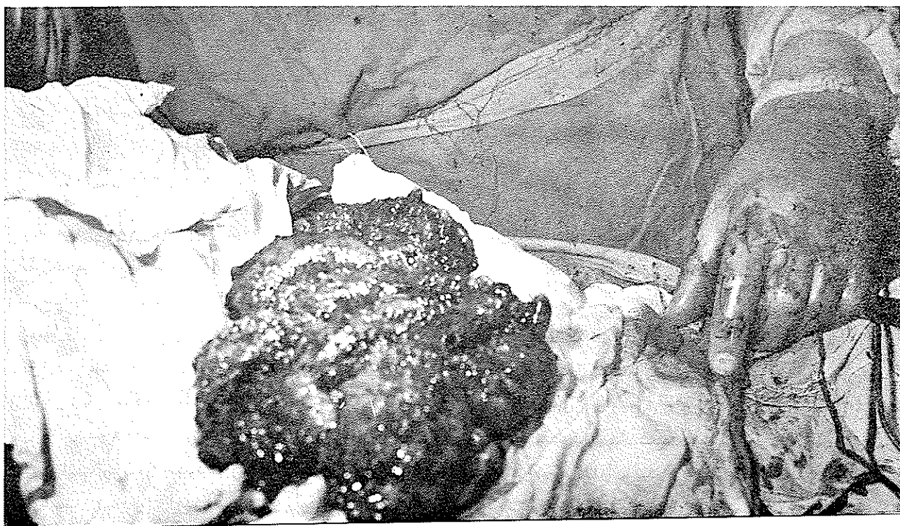
عکس شماره ۵ و ۶؛ تقریباً "تمام روده" کوچک را نشان می‌دهد که در سرتاسر آن حبابهای پر از گاز به اندازه‌های مختلف وجود دارد و، نمای روده نمای اسفنجی می‌باشد .