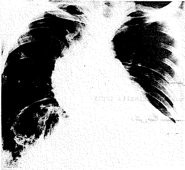
عکس شماره یک:

اسکولیوز پیشرفته ستون فقرات لومبوساکره را نشان می‌دهد.