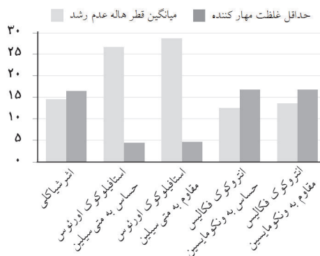
نمودار- ۱: بررسی هم زمان نتایج دیسک دیفیوژن با MIC روی سویه های باکتریایی مختلف