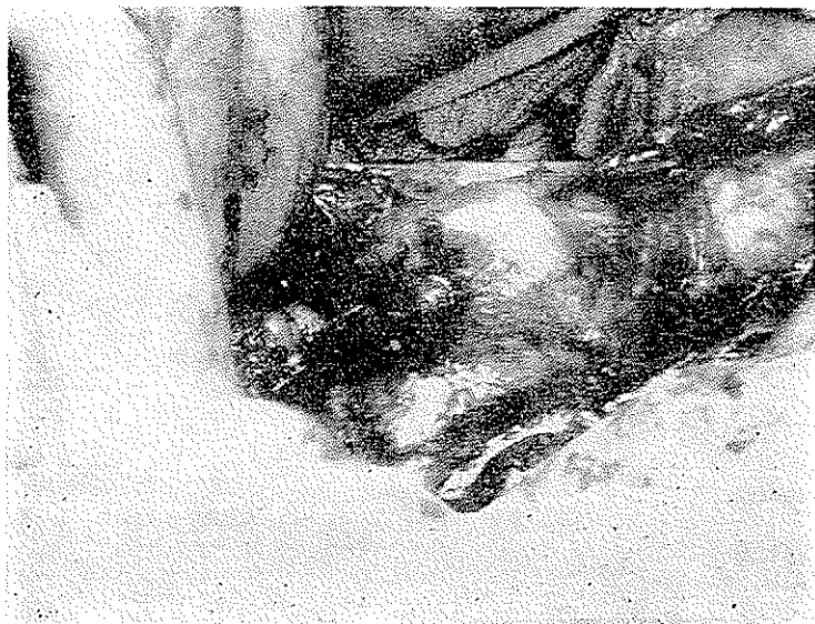
شکل ۱- آنوریسم آبدومینال

خون منفی الکتروکاردیوگرام مختصر سورشارژ چپ و عکس سینت برجستگی قوس آنورت را نشان میداد. عکس نیمرخ شکم کلسیفیکاسیون محدود آنورت آبدومینال را نشان میداد.