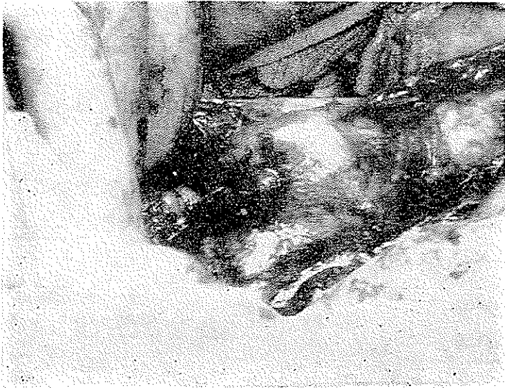
شکل ۱- آنوریسم آبدومینال

خون منفی الکتروکاردیوگرام مختصر سورشارژ چپ و عکس سینت برجستگی قوس آنورت را نشان میداد. عکس نیمرخ شکم کلسیفیکاسیون محدود آنورت آبدومینال را نشان میداد.