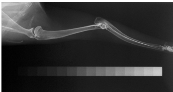
شکل-۱: قرار گرفتن گوه پله‌ای (Step Wedge) در کنار استخوان

از نظر وزن بدن تفاوت معنی‌داری بین گروه‌های آزمایش و کنترل دیده نشد. IGF-I سرم خون در گروه آزمایش و کنترل قبل از تجویز هورمون رشد با هم تفاوت معنی‌داری نداشت ولی IGF-I در گروه آزمایش دو هفته پس از شروع تجویز هورمون رشد به‌طور معنی‌داری نسبت به گروه کنترل افزایش یافت ( P < 0/05 ). قبل از تجویز هورمون رشد غلظت IGF-I سرم خون 222 \pm 51 \text{ ng/l} بود و بعد از دو هفته غلظت سرمی به 270 \pm 64 \text{ ng/l} رسید که حدود ۲۱٪ افزایش نشان می‌دهد. غلظت IGF-I سرم خون در گروه کنترل در ابتدا 273 \pm 83 \text{ ng/l} بود و بعد از دو هفته غلظت سرمی به 272 \pm 102 \text{ ng/l} رسید که نشان دهنده کاهش جزئی IGF-I در این گروه می‌باشد. دانسیته استخوانی در تمام نواحی اندازه‌گیری شده به استثنای اپی‌فیز پایینی استخوان ران افزایش یافت اما دانسیته استخوانی تنها در وسط شفت استخوان ران با گروه کنترل از نظر آماری تفاوت معنی‌داری نشان داد ( P < 0/05 ). دانسیته استخوانی در تمام نواحی اندازه‌گیری شده به استثناء اپی‌فیز پایینی استخوان ران در مرحله دوم (سه هفته پس از تجویز GH) مقداری کاهش یافت، ولی در تمام این نواحی در مراحل بعدی افزایش دانسیته دیده شد (شکل ۲).