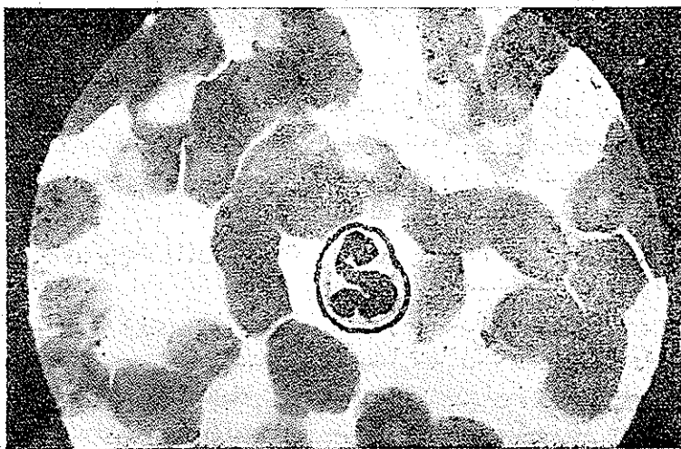
نمای ریبینی گویچه سفید چند هسته‌ای معمولی که فاقد زانده

فقط نوتروفیل‌های رسیده با هسته های تقسیم شده باید مورد آزمایش قرار گیرد تا اینکه حداقل ۶ جسم گریزشکل کامل دیده شود (هسته ماده) ولی اگر ۵۰۰ نوتروفیل مورد آزمایش قرار گیرد و هیچکدام محتوی زواند مذکور نباشد باید نتیجه آزمایش را مذکر شناخت معمولاً تعداد چوب طلها باسن و یا سایر عوامل فرق میکند لهذا ممکن است در يك مورد برای یافتن ۶ عدد آنها فقط صد نوتروفیل امتحان