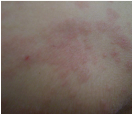
شکل - ۳: نمای نزدیک ضایعات