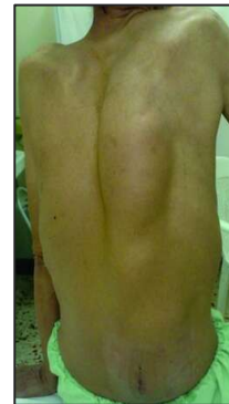
شکل ۱: آقای ۶۱ ساله با شکایت توده در پشت از شش سال قبل با رشد تدریجی