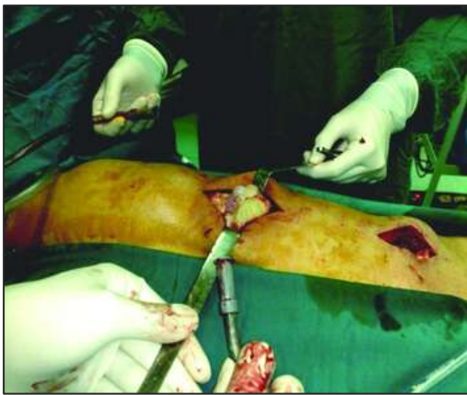
شکل ۳: خارج شدن اسکولکس‌ها در حین جراحی