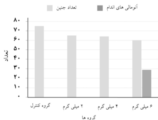
نمودار-۲: مقایسه میزان بروز آنومالی‌های اندام در گروه‌های کنترل و آزمایشی

غلظت پلاسمایی را بین یک تا دو ساعت ایجاد می‌کند. ۱۹ مطالعات بر روی این خانواده دارویی از سال‌های ۱۹۶۰ آغاز گردید. ۳ در مطالعات انجام شده، بروز شکاف کام و آنومالی‌های اندام گزارش شده است. ۱۲-۱۳ با توجه به این که آلپرازولام به عنوان کم‌خطرترین داروی خواب‌آور ضد تشنج معروف شده است، مصرف خودسرانه این دارو با دوزهای بالا رایج گردیده است. ۱۹ ماه‌های اول بارداری دوران حساس شکل‌گیری جنین و دوران ارگانوژنز می‌باشد، با توجه به اینکه بعضی از خانم‌ها در ماه‌های اول از بارداری خود خبر نداشته و یا ناآگاهانه در کم‌خوابی و یا بنا به ضرورت درمان بعضی بیماری‌ها، از این دارو استفاده می‌کنند، این امر می‌تواند موجب تأثیر منفی بر ارگانوژنز و تکامل طبیعی جنین گردد. ۱۴ طبق نتایج به‌دست آمده از جنین‌های سزارین شده ۱۷ روزه گروه کنترل در بررسی ماکروسکوپی و مورفولوژی ظاهری، بدن خمیدگی طبیعی C شکل خود را حفظ کرده و اندام‌ها در وضعیت طبیعی خود قرار گرفته‌اند. سر و صورت و پوزه شکل گرفته و چشم‌ها و گوش‌ها و بینی و دهان وضعیت طبیعی خود را به‌دست آورده‌اند. در این گروه (کنترل) کلیه جنین‌ها حالت طبیعی داشتند. در بررسی‌های میکروسکوپی گروه کنترل نیز مورد خاصی دیده نشد و همگی حالت طبیعی داشتند. در مطالعه ما، گروه‌های آزمایشی ۴ mg/kg/day و ۲، در حد مجاز آلپرازولام دریافت کرده‌اند. در بررسی‌های مورفولوژیک ماکروسکوپی، مشاهده گردید که نمای ظاهری جنین‌ها از نظر ارگانوژنز و قرارگیری اندام‌ها در جای طبیعی خود تفاوت بارزی با گروه کنترل ندارند و اختلاف این دو گروه با گروه کنترل معنی‌دار نمی‌باشد. در بررسی نمونه‌ای گروه آزمایشی ۶ mg/kg/day، مشاهده