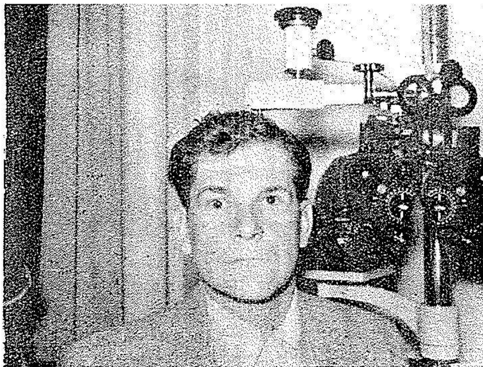
شکل ۱ - قبل از عمل ۱۲ اپریل ۱۹۵۶

این عکس بنحوی نشان میدهد که چشم چپ بیمار بالاتر از چشم راستش میباشد امتحان حرکات عضلات چشم: