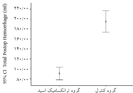
نمودار-۱: مقایسه میانگین خونریزی کلی پس از عمل بین دو گروه ترانکسامیک اسید و شاهد در لامینکتومی یک طرفه و یک سطح ( p<۰/۰۰۵ )

قرار گرفتند بین میانگین سن، فراوانی دو جنس و BMI اختلاف معنی داری در دو گروه دیده نشد. اما بین دو گروه ترانکسامیک اسید و شاهد خونریزی در ۲۴ ساعت اول (به ترتیب ۵۵/۸±۱۰/۰۷ در برابر ۳۵±۳۲/۴۷ میلی لیتر، p=۰/۰۰۱ ) و در ۲۴ ساعت دوم (۹۰/۸±۳۰/۸۸ در برابر ۱۱۶/۴±۳۴/۰۵ میلی لیتر، p=۰/۰۰۱ ) و در کل (۲۱۲/۸±۲۰/۰۶ در برابر ۲۰۵/۸±۱۷/۶۶ میلی لیتر، p=۰/۰۰۱ ) به میزان معنی داری در گروه ترانکسامیک اسید کمتر بود. همچنین در گروه لامینکتومی دوطرفه در دو سطح نیز ضمن این که سن بیماران اختلاف معنی داری نشان داد، اما فراوانی دو جنس و شاخص توده بدن BMI اختلاف معنی داری بین دو گروه نشان ندادند. همچنین خونریزی در ۲۴ ساعت اول (به ترتیب ۹۷/۴±۱۳/۳۹ در برابر ۱۷۹/۶±۲۱/۷۹ میلی لیتر، p=۰/۰۰۱ ) و در ۲۴ ساعت دوم (۱۱۵/۴±۱۲/۴۹ در برابر ۲۱۲/۸±۲۰/۰۶ میلی لیتر، p=۰/۰۰۱ ) و خونریزی کلی (۲۱۲/۸±۲۰/۰۶ در برابر ۳۸۵/۴±۳۷/۸ میلی لیتر؛ p=۰/۰۰۱ ) نیز به میزان معنی داری در گروه ترانکسامیک اسید نسبت به گروه شاهد کمتر بود، ضمن این که مدت بستری نیز در گروه ترانکسامیک کوتاه تر بود (۲/۱۶±۰/۳۷ در برابر ۲/۹۶±۰/۸۹ روز، p=۰/۰۰۱ ). هیچ بیماری از مطالعه خارج نشد و بر اساس نتایج به دست آمده، خونریزی در ۲۴ ساعت اول و دوم پس از عمل و خونریزی کلی پس از عمل در هر دو گروه لامینکتومی یک طرفه یک سطح (نمودار ۱) و دوطرفه در دو سطح (نمودار ۲) در گروه ترانکسامیک اسید به میزان معنی داری از گروه شاهد کمتر بود. همچنین طول مدت بستری نیز در گروه لامینکتومی دوطرفه در دو سطح کوتاه تر بود. موردی از تریق خون و عوارض جانبی نداشتیم.