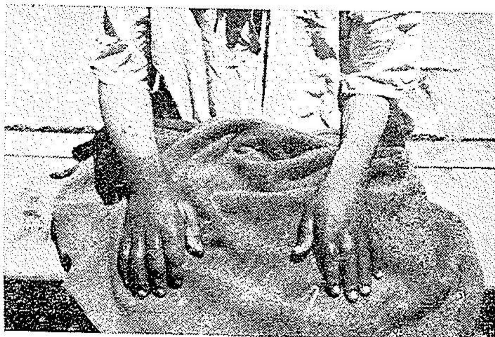
شکل ۱ - س - ۱ عوارض در دو دست