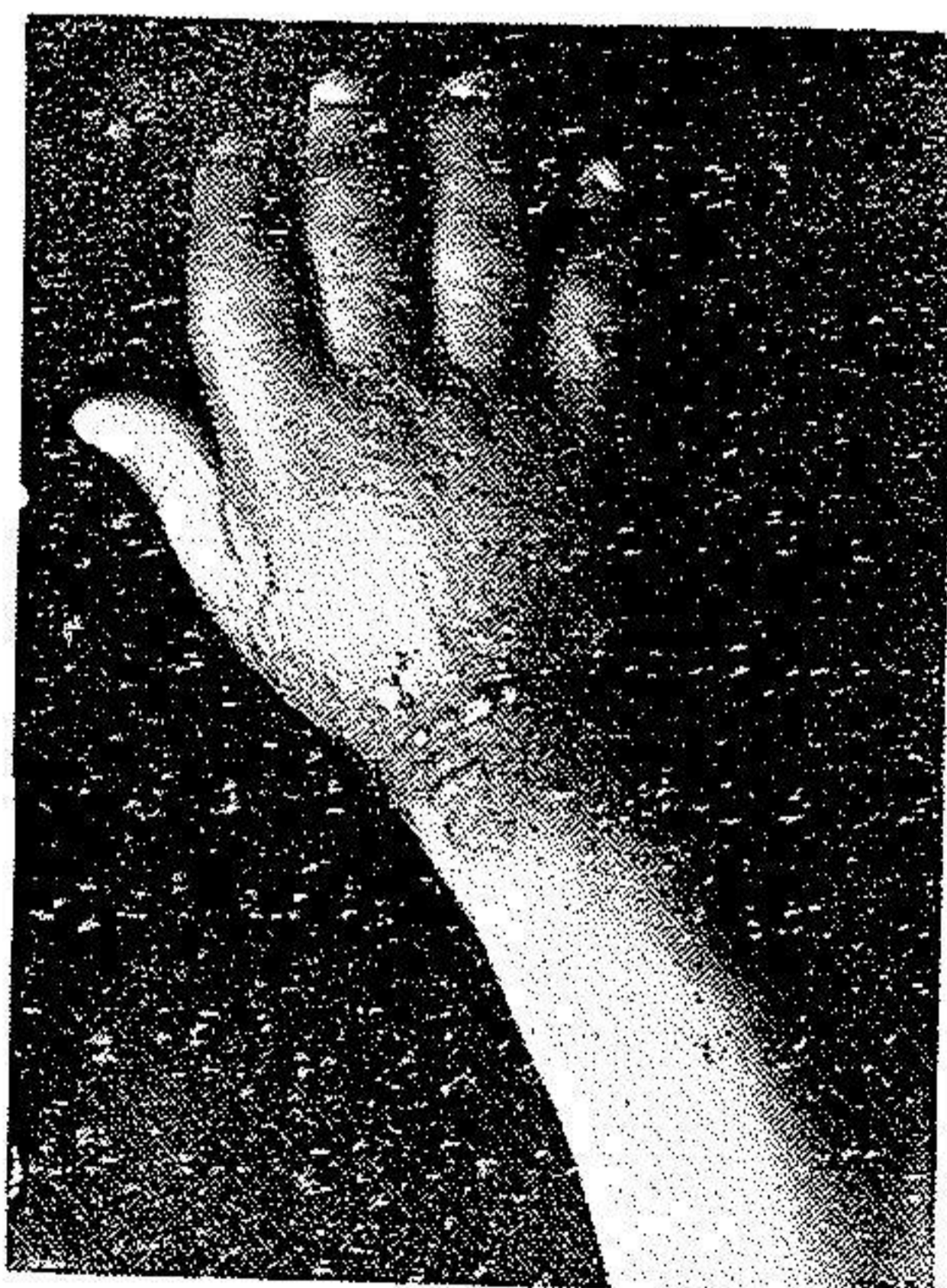
شکل ۲ - س - ۱ ضایعات با ندولها