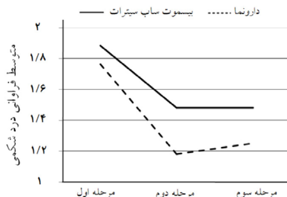
نمودار- ۱: کاهش فراوانی درد شکمی در طول مطالعه به تفکیک در دو گروه

سندرم روده تحریک‌پذیر با ارجحیت نسبی علامت یبوست، البته تعدادی از این بیماران را نمی‌توان در هیچ کدام از این دو گروه تقسیم کرد، به طوری که در دوره‌ای از زمان علامت اسهال و در دوره‌های دیگر علامت یبوست غالب می‌شود. در این بیماری علاوه بر درد شکمی علائم گوارشی دیگر مثل احساس نفخ شکمی، آروغ زدن اغلب به طور شایع دیده می‌شود هر چند که برای تشخیص بیماری وجود آنها الزامی نیست. ۴ برای تشخیص این بیماری در اکثر مطالعات از معیارهای Rome استفاده شده بود که ما نیز در مطالعه خود از آخرین معیاری موجود Rome یعنی Rome III استفاده کردیم. پاتوژنز احتمالی این بیماری به طور کامل شناخته شده نیست ولی علتی که در مطالعات اخیر به آن توجه بیشتری شده است تغییر در فلور میکروبی طبیعی دستگاه گوارش می‌باشد. ۵ به علاوه مطالعاتی نیز وجود دارند که نشان می‌دهند درمان کوتاه‌مدت با آنتی‌بیوتیک منجر به بهبودی قابل توجهی در علائم گوارشی این بیماران شده است. ۶ بنابراین ما نیز در این مطالعه اثر آنتی‌بیوتیک غیرقابل جذب بیسموت ساب‌سیترات را در گروهی از این بیماران که با علامت ارجح اسهال مراجعه کرده بودند مورد مطالعه قرار داده و اثر آن را با گروه مشابه دیگری که دارونما را دریافت کرده بودند، مقایسه کردیم. ما مطالعه