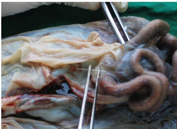
شکل-۵: مورد ۲- روده همراه با بند ناف نازک به طول ۴cm متصل به جفت