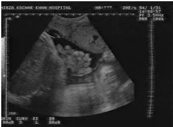
شکل-۴: مورد ۲- تصویر ساک آمینوتیک با مایع کاهش یافته بدون پای هیپوپلاستیک در ۳۸ هفته