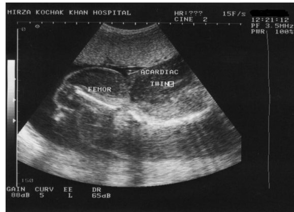
شکل-۱: جنین آکاردیا، مورد ۱- تصویر سونوگرافی از ستون مهره‌های هیپوپلاستیک و فمور در سن حاملگی ۲۶ هفته