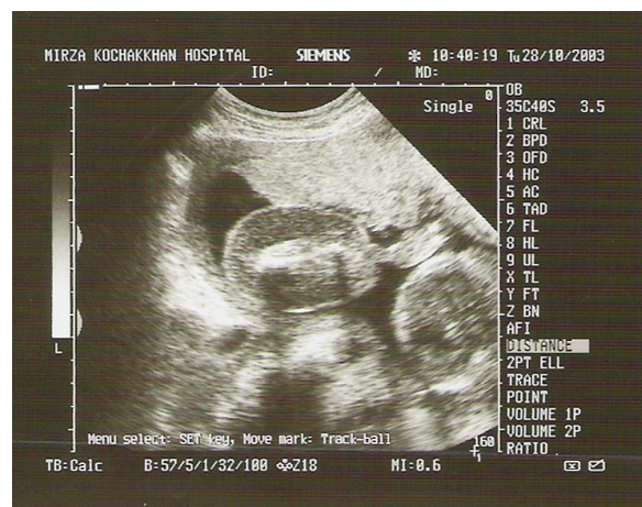
شکل-۳: مورد ۲- پای هیپوپلاستیک و ادم زیر جلد جدا از نسج آمورف در سن حاملگی ۲۶ هفته

آنومالی آکاردیا یک حالت نادر در حاملگی‌های چندقلویی منوکوریونیک است. پاتوفیزیولوژی آنومالی آکاردیا به طور کامل درک نشده است. دو تئوری برای توضیح منشأ آنومالی آکاردیا ذکر شده است. یک تئوری، آناستومز عروقی غیر طبیعی در سطح جفت را که منجر به جریان خون معکوس و رشد غیر طبیعی قل گیرنده می‌شود. تئوری دیگر رشد جنینی غیر طبیعی قلب به عنوان یک اتفاق اولیه را عامل می‌داند. به هر حال اثبات وجود ضریان قلب نرمال در مراحل اولیه حاملگی با معکوس شدن جریان خون و ناپدید شدن فعالیت قلب جنین مطرح‌کننده این است که نقص اولیه آناستومز عروقی در سطح جفت علت آن است. دوقلویی آکاردیا درجات متغیری از اختلال رشد را نشان می‌دهند، شایع‌ترین تظاهر آن به صورت آکاردیای acephalus است که سر و اندام‌های فوقانی رشد نمی‌کنند ۳