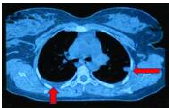
شکل ۲: ندول در لوب تحتانی ریه چپ و پلورال افیوژن در همی‌توراکس راست

حدود سه لیتر خون، دو لیتر لخته همراه با مقدار زیادی وزیکول از داخل شکم ساکشن شد. میومتر رحم در ناحیه فوندوس کاملاً باز شده بود. هم‌زمان ساکشن کورتاژ انجام شده محتویات رحم که پر از