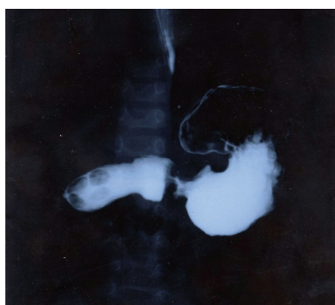
شکل ۱- کلیشه فالوترو: عبور باریک از معده طبیعی، اتساع بولب دوازدهه و ابتدای D۲

بیمار پنجم: پسر ۳/۵ ماهه به علت استفراغ‌های غیر صفراوی پیشرونده که از یک ماه قبل شروع شده بود مراجعه کرد. شیرخوار کاهش رشد داشت و وزن وی در حد ۳/۵ کیلوگرم بود. در گرافی