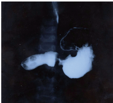
شکل ۱- کلیشه فالوترو: عبور باریک از معده طبیعی، اتساع بولب دوازدهه و ابتدای D۲

بیمار پنجم: پسر ۳/۵ ماهه به علت استفراغ‌های غیر صفراوی پیشرونده که از یک ماه قبل شروع شده بود مراجعه کرد. شیرخوار کاهش رشد داشت و وزن وی در حد ۳/۵ کیلوگرم بود. در گرافی