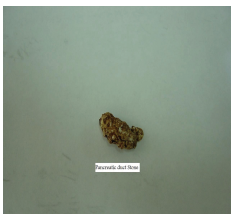
شکل - ۴: سنگ پانکراس که به دنبال عمل جراحی خارج شد.

که در تاریخ ۱۳۷۰/۶/۱۴ به درمانگاه جراحی بیمارستان قائم (عج) مراجعه نموده است، درد بیمار در ناحیه اپی گاستر با انتشار به دور کمر، از ابتدا شدید و مداوم بوده است بگونه ای که تزریق مواد مخدر نیز به مدت کوتاهی درد را تسکین می بخشید و حتی نظم بخش جراحی را به هم زده بود. در این مدت بیمار کاهش وزن به میزان ۱۵ کیلوگرم را نیز ذکر می نمود، در CT اسکن و سونوگرافی اتساع واضح مجرای پانکراس دیده نشده، آندوسکوپی انجام شده ولی انجام ERCP میسر نگردید. در آزمایشات انجام شده یافته ای غیر طبیعی دیده نشد و در محدوده نرمال بود. بیمار سابقه الکلیسم نداشت و در بررسی سنگ صفراوی نیز نداشت. همچنین لیپید و کلسیم سرم بررسی شد نرمال بود، هیچگونه سابقه درد شکمی قبل از شروع بیماری نداشته است. بالاچار بیمار لاپاراتومی گردید. پانکراس کوچک و نسبتاً سفت و سفید رنگ بود و در قسمت میانی مجرای پانکراس متسع و برجسته بود. پانکراتیکوگرافی حین عمل با ماده حاجب اوروگرافی