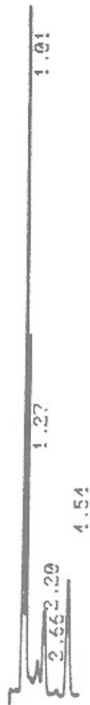
شکل ۲) کروماتوگرام مربوط به آنالیز ویتامین A شیر توسط ستون با فاز معکوس و سیستم شناسایی UV-Vis، رتینول (RT=۴/۵۴)

اسپکتروفلوریمتری مشخص شد که پیکهای مربوط به ایزومرهای ۱۳-سیس و all-trans رتینول در ستون با فاز نرمال جداسازی کاملی از خود نشان می دهند که این حالت با استفاده از ستون با فاز معکوس مشاهده نشد (شکل ۱).