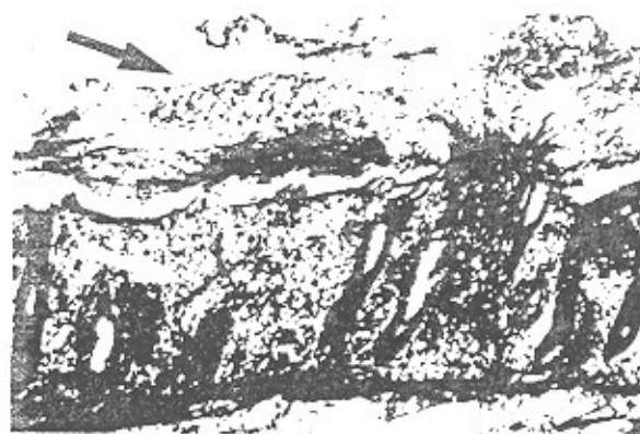
شکل ۱ - پلاکهای سودوممبران ناشی از کلستریدیوم دیفیسیل