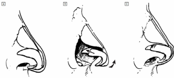
شکل- ۲: روش شماتیک انجام جراحی به روش Lateral crural overlay