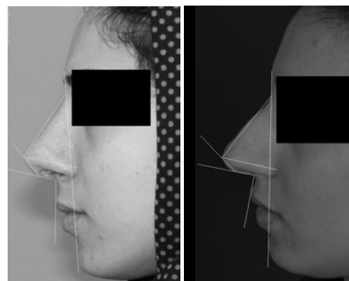
شکل‌های- ۳ و ۴: تصویر زوایا صورت بیمار در گروه Lateral crural overlay قبل (راست) و پس از عمل (چپ).