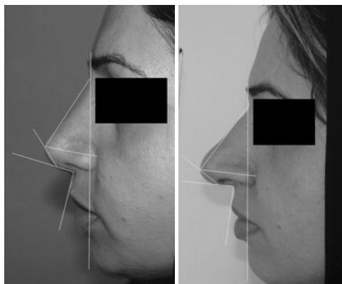
شکل‌های- ۵ و ۶: تصویر زوایا صورت بیمار در گروه Septocolumellar suture قبل (راست) و پس از عمل (چپ).