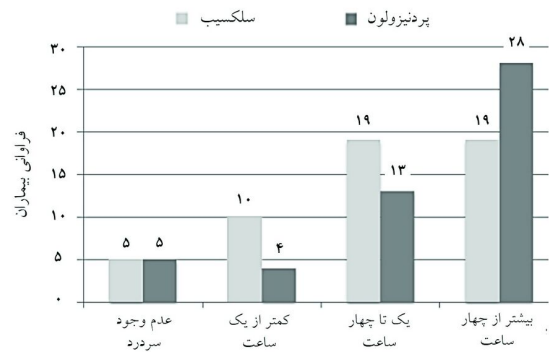
نمودار ۱: مقایسه مدت سردرد در طول روز بر حسب ساعت در گروه‌های مورد مطالعه

نشان داد بیمارانی که داروی سلکسیب مصرف کرده بودند از نظر سردرد دارای بیش‌ترین فراوانی در گروه ۱-۴ ساعت (۱۹ مورد) و بیش‌تر از چهار ساعت (۱۹ مورد) بودند. در حالی‌که بیش‌ترین