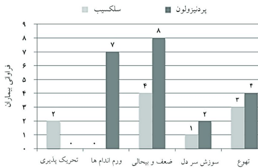
نمودار ۲: مقایسه بروز عوارض دارویی ایجاد شده در گروه‌های مورد مطالعه

*آزمون آماری: Student's t-test، P < ۰/۰۵ معنادار می‌باشد.