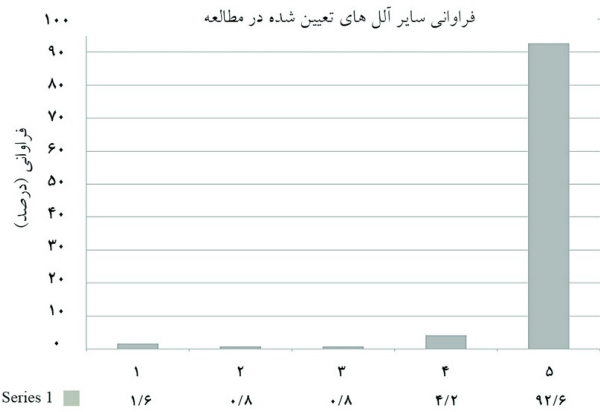
نمودار ۱: فراوانی سایر آلل‌های تعیین شده در مطالعه

سپاسگزاری: این مقاله حاصل پایان‌نامه و طرح تحقیقاتی تحت عنوان "بررسی فراوانی آلل HLA-B*57:01 در بیماران HIV مثبت مراجعه‌کننده به مرکز مشاوره بیماری‌های رفتاری بیمارستان امام خمینی در سال ۱۳۹۱" در مقطع دکترای تخصصی بیماری‌های عفونی و گرمسیری در سال ۱۳۹۲ و کد پایان‌نامه ۲۰۵ و کد طرح ۹۱-۰۱-۵۵-۱۷۳۴۹ می‌باشد که با حمایت مرکز تحقیقات ایدز ایران، مرکز مشاوره بیماری‌های رفتاری بیمارستان امام خمینی و گروه بیماری‌های عفونی و گرمسیری دانشگاه علوم پزشکی و خدمات بهداشتی درمانی تهران اجرا شده است.