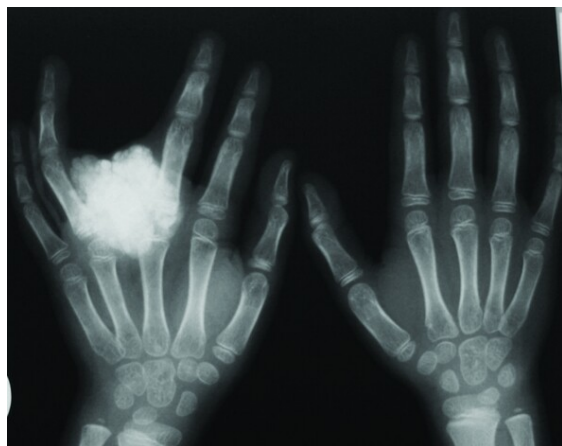
شکل ۱: کلسیفیکاسیون متاکارپ‌های سوم و چهارم

ابتدا درد از ناحیه هیپ چپ شروع شد. شش ماه پس از آن دچار تورم بین انگشتان چهارم و پنجم دست شد که تحت عمل جراحی قرار گرفت و یک‌سال بعد نیز به خاطر درد و تورم هیپ چپ نیز تحت عمل جراحی قرار گرفت و در معاینه، توده سفت، قرمز و