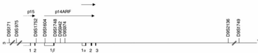
شکل ۱: آرایش اگزون‌های (1a, 1b, 2, 3) ژن CDKN2A بر روی ناحیه کروموزومی 9p16

ژن CDKN2A (Cyclin-dependent kinase inhibitor 2A)، (p16 و MTS1, INK4A) با چهار اگزون (1a, 1b, 2, 3) بر روی ناحیه کروموزومی 9p16 قرار گرفته است (شکل ۱). رونوشت رمزکننده CDKN2A با اگزون 1b آغاز می‌شود. ۱۸،۱۷ پروتیین CDKN2A به‌وسیله مهار مجموعه پروتیینی cyclinD- Cdk4/6 موجب توقف چرخه یاخته در فاز G0 یا G1 می‌گردد. مهار Cdk4/6 به‌وسیله CDKN2A همچنین موجب کاهش سطح