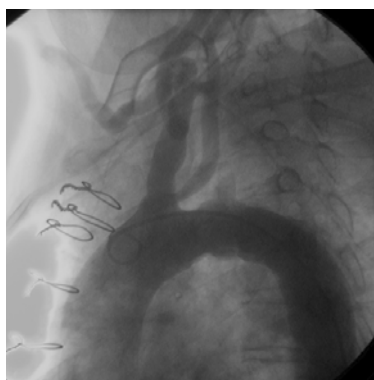
شکل ۲- تزریق شریان کرونر اصلی چپ: پرشدن معکوس ساب کلاوین از IMA چپ