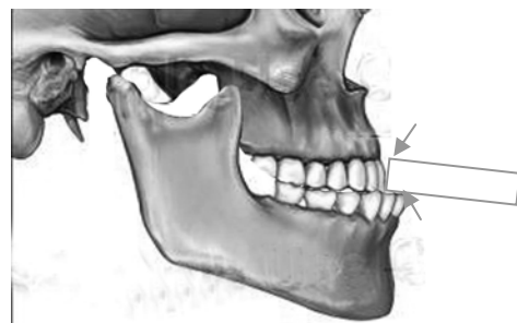
شکل-۱: روش اندازه‌گیری در حالی که کوندیل فک تحتانی با حرکت چرخشی از لولای مفصل جدا شده و به طرف جلو لغزیده و بالای توپرکل مفصل قرار گرفته است.