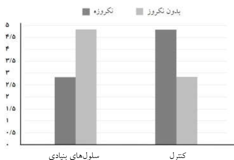
نمودار ۱: مقایسه نکروز اپیدرم و ضمامم درمی در دو گروه

مقادیر میانگین سطح مقطع سالم فلپ در دو گروه و مقایسه آن‌ها در جدول ۱ نشان داده شده است بر اساس محاسبات انجام شده