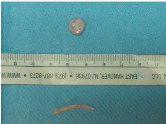
شکل ۴: غضروف‌های خارج شده دنده (پایین) و گوش (بالا)