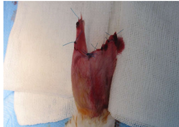
شکل ۳: برداشتن غضروف گوش

از غضروف جدا شده عکسبرداری انجام شد (شکل ۴). هر چند افزون بر وزن غضروف و باقی‌ماندن حجم و فرم آن در جراحی پلاستیک اهمیت زیادی دارد، در این مطالعه فقط وزن آن‌ها اندازه‌گیری شد و داده‌های در فرم مربوطه ثبت شد. نمونه‌ها در محلول فرمالین ۱۰٪ فیکس شد و جهت بررسی پاتولوژی فرستاده شد. در ادامه نمونه‌ها برش داده شده و رنگ‌آمیزی به روش هماتوکسلین و انوزین (H&E) انجام شد و نمونه‌ها از نظر میزان کندروسیت‌های زنده و فیروز توسط پاتولوژیست مورد بررسی قرار گرفت. نتایج حاصل از بررسی در هر یک از انواع گرفت‌ها در فرم‌های ویژه ثبت شد و سپس توسط SPSS software version 19 (IBM SPSS, Armonk, NY, USA) تحلیل گردید.