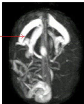
شکل ۲: سیستم وریدی متسع در MRV

مالفورماسیون شریانی- وریدی مغزی آنومالی‌های عروقی نادری هستند. نارسایی احتقانی قلبی در دوره نوزادی در بیشتر موارد ناشی از نقایص ساختمانی قلب است. از این رو در صورت مواجه شدن با شواهد نارسایی قلبی در دوره نوزادی در ابتدا باید علل شایعتر آن را رد نمایم و در نهایت بررسی از نظر مالفورماسیون شریانی- وریدی مغزی انجام گیرد. همانند نوزاد مورد مطالعه ما به ندرت اولین سرخ تشخیصی می‌تواند به صورت یک الگوی غیرطبیعی ضربان قلبی جنین و عدم واکنش آزمون غیر استرس باشد. مشابه با مطالعه ما ممکن است یک ارتباط دو طرفه بین نقص دیواره دهلیزی و مالفورماسیون شریانی- وریدی مغزی وجود داشته باشد. نوزادان مبتلا به مالفورماسیون شریانی- وریدی مغزی که به صورت نارسایی احتقانی قلبی در روزهای اول تولد تظاهر می‌یابد پیش‌آگهی بسیار بدی داشته و اغلب پیش از هرگونه درمان قطعی فوت می‌کنند. بنابراین تشخیص زودرس و انجام مداخله درمانی پیش از رسیدن به مرحله برگشت‌ناپذیر بسیار دارای اهمیت می‌باشد.