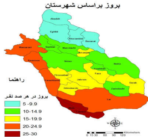
نقشه ۱: بروز نقص آنزیم G6PD بر اساس شهرستان در استان فارس بین سالهای ۱۳۹۰ تا ۱۳۹۴

بر اساس نتایج پژوهش کنونی میزان بروز نقص آنزیم G6PD در نوزادان استان فارس با استفاده از آزمون غربالگری ۱۵/۸۵٪ تولد زنده (نوزادان پسر ۱۶/۲۵٪ و دختر ۱۴/۸۵٪) برآورد شد. در مطالعه‌ای که توسط Kazemi و همکاران در تهران انجام شد بروز نقص آنزیم G6PD در کل نوزادان ۲/۲٪ تولد زنده برآورد شد. Nourbakhsh و همکاران بروز این نقص در نوزادان تازه متولد شده در شهرکرد را