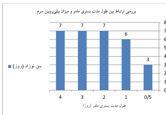
نمودار ۱: ارتباط بین مدت بستری مادر و بیلی‌روبین سرم نوزاد