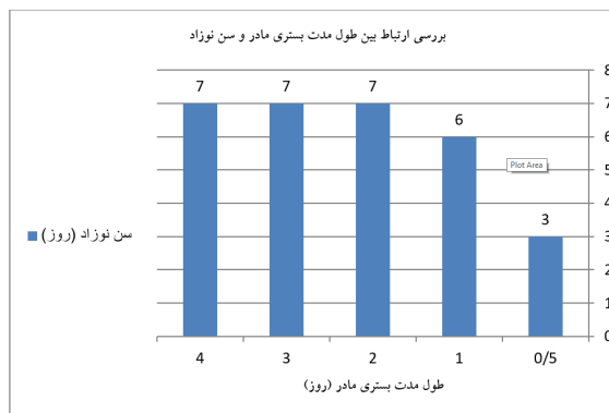
نمودار ۲: بررسی ارتباط بین طول مدت بستری مادر و سن نوزاد

طبیعی میسر نبوده و یا با خطراتی برای جنین یا مادر همراه باشد. در حالی‌که زایمان واژینال منجر به کاهش بستری در بخش مراقبت‌های ویژه نوزادان و کاهش نیاز به اکسیژن نوزادی می‌شود. ۲۰ در یک مطالعه، میانگین مدت بستری در گروه زایمان سزارین کمابیش دو برابر گروه زایمان طبیعی بود. ۲۱ در مطالعه Boskabadi و همکاران، میزان بیلی‌روبین توتال در دو گروه از نوزادان متولد شده به روش‌های سزارین و طبیعی تفاوت معناداری نداشت ولی مدت بستری مادر تفاوت معناداری داشت. میانگین مدت بستری شدن مادر در بیمارستان در گروه سزارین در مقایسه با گروه زایمان طبیعی به‌طور معناداری