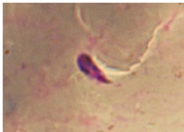
شکل-۲: اووکینت موجود در خون خورده شده در معده پشه‌های An. stephensi mysorensis به روش in vivo (۲۰ ساعت پس از آلودگی)

از آنجائیکه مالاریای انسانی تنها از طریق گزش پشه آلوده امکان‌پذیر است، لذا بلوک کردن سیکل انتقال اقدام کنترل‌کننده مؤثری خواهد بود. با این حال هنوز یک مکانیسم صحیح از روشهای بلوک‌کننده انتقال در دست نمی‌باشد و این مسأله بیشتر به خاطر ملکولهای هدف، که لازمه رشد انگل در بدن میزبان می‌باشد و هنوز به درستی شناخته نشده‌اند، می‌باشد هر چند که ممکن است فاکتورهای رفتاری و اکولوژیکی تا حدودی مسئول این موضوع باشند اما فاکتورهای ژنتیکی، بیوشیمیایی و فیزیکی نقش اصلی را در آلودگی‌های پائین‌بازی می‌نمایند. ۱۰ مطالعات آزمایشگاهی نشان می‌دهد پشه‌هایی که به عنوان ناقلین مهم مالاریا مطرحند مثل An. gambiae بشکل مؤثری بیش از ۹۹/۹٪ رشد انگلهای بلعیده شده را بلوک کرده، در حالیکه گونه‌های مقاوم قادرند این کار را تا ۱۰۰٪ انجام دهند. ۱۳ این مطالعه نشان می‌دهد که An. Stephensi mysorensis در ایران قادر است ۹۳/۹۱٪ رشد انگل‌های بلعیده شده را بلوک نماید. ۱۳ بنابراین می‌توان با اطمینان اظهار کرد که پشه‌ها به شکل ژنتیکی نسبت به پلاسمودیوم مقاومند لذا این مسئله دال بر موانع رشد انگل در پشه هاست که در صورت شناخته شدن ما را در پیشرفت اقدامات مؤثر علیه مالاریا و کنترل آن، رهنمون خواهد کرد. تا کنون سیکل اسپروگونی انگل مالاریا به شکل گسترده‌ای مورد مطالعه قرار گرفته و بسیاری از فاکتورهایی را که بر روی رشد انگل در معده پشه تأثیر می‌گذارند، شرح داده شده است. ۱۴-۱۶ این سیکل در An. stephensi برای انگل P. vivax توسط Nanda و همکاران در سال ۱۹۸۵ مورد مطالعه قرار گرفت. ۱۷