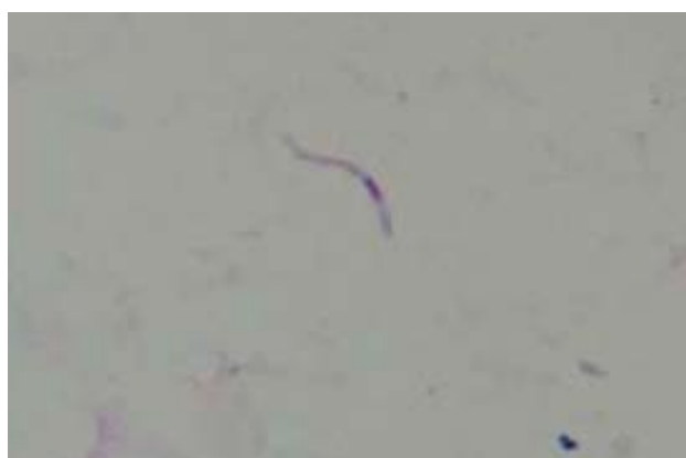
شکل-۳: اسپروزوتیهای مشاهده شده در غدد بزاقی An. stephensi mysorensis (۶ تا ۸ روز پس از آلودگی)