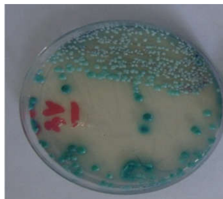
شکل ۲: کلنی سبز رنگ کاندیدا آلبیکنس بر روی محیط کروم آگار کاندیدا

عدم مصرف آنتی‌بیوتیک با کاندیدیازیس واژینال در زنان باردار از نظر آماری اختلاف معنادار مشاهده گردید ( P < 0.003 ). نتیجه کشت نمونه‌های واژینال بر روی محیط کروم آگار کاندیدا در ۲۰ مورد مثبت بود و ۲۲ ایزوله شناسایی شدند. در این مطالعه در ۱۶ مورد (۷۲/۸٪) کلنی سبز رنگ به‌عنوان کاندیدا آلبیکنس (شکل ۲)، پنج مورد (۲۲/۷٪) کلنی بنفش رنگ به‌عنوان کاندیدا گلابراتا (شکل ۳) و یک مورد (۴/۵٪) کلنی صورتی رنگ به‌عنوان کاندیدا کروزه‌ای (شکل ۴) شناسایی شد. از نمونه ترشحات واژینال دو بیمار، دو گونه متفاوت به رنگ‌های