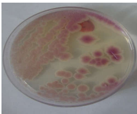
شکل ۴: کلنی کاندیدا کروزه‌ای بر روی محیط کروم آگار کاندیدا