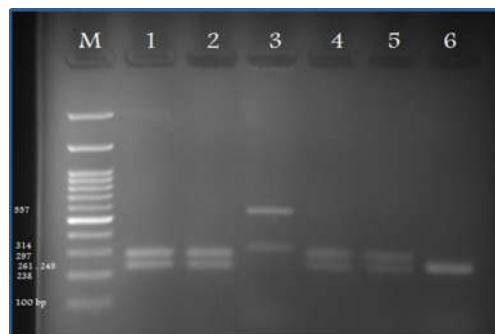
شکل ۶: نمونه‌ای از نتایج الکتروفورز PCR-RFLP پس از هضم آنزیمی توسط آنزیم MSPI

M: DNA Ladder; 1, 2, 4, and 5: Candida albicans ; 3: Candida glabrata ; Candida krusei