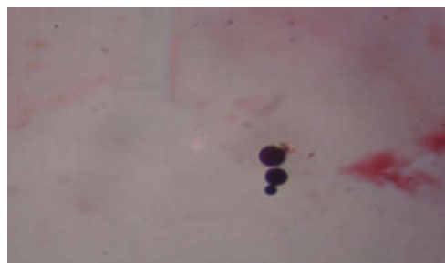
شکل ۱: سلول‌های مخمری جوانه‌دار در بررسی میکروسکوپی لام‌های رنگ آمیزی شده از ترشحات واژینال به روش گرم (درشت‌نمایی ۱۰۰۰).