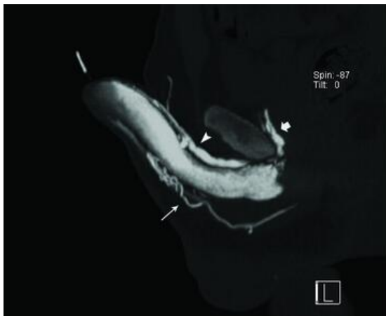
شکل - ۱: سی تی کاورنوزوگرافی تکنیک MIP نشانگر نشت وریدی در ورید عمقی پشتی (سرفلش)، نشت ورید یورترال (فلش نازک بلند) و ورید کرورال (Crural) (فلش ضخیم کوتاه).