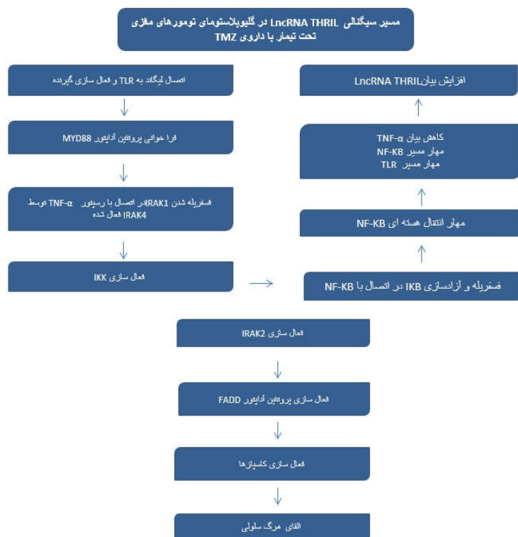
شکل ۱: تصویری شماتیک از مسیب سیگنالی LncRNA THRIL در سلول‌های گلیوبلاستومای تیمار شده توسط تموزولامید که مسیرهای TLR و TNF-α (NF-κB) را درگیر می‌کند. در نهایت باعث کاهش بیان TNF-α، مهار مسیب NF-κB و مهار مسیب TLR می‌شود. ۱۰