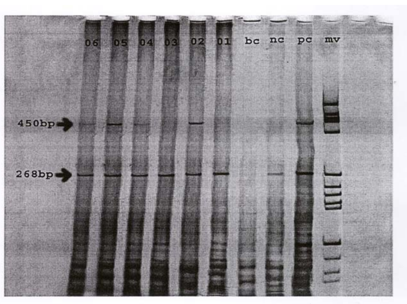
شکل ۲- یک نمونه از ژل پلی‌اکریل آمید

ضایعات دهانه رحم ۷۰٪ گزارش شد که البته در آن مطالعه از روش هیبریداسیون ملکولی In-Situ استفاده شده بود. مطالعات اپیدمیولوژیک مهم‌ترین عوامل خطر برای ایجاد سرطان دهانه رحم، بعد از HPV را: ۱) سن پایین بهنگام اولین مقاربت، ۲) وجود شرکای جنسی متعدد و ۳) تعدد مقاربت می‌دانند؛ در ادامه از عوامل دیگر می‌توان به موارد ذیل اشاره نمود: ۴) تعداد بارداری‌ها و پیدایش اولین بارداری در سنین پایین و قبل از ۱۸ سالگی، ۵) تماس جنسی با مردان پرخطر (مردانی که با زنان متعدد تماس جنسی دارند)؛ ۶) مصرف قرص‌های